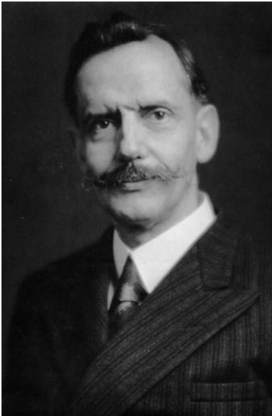
Carlos Vaz Ferreira (1872-1958)