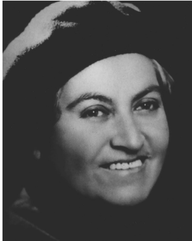
Gabriela Mistral (1889-1957)

Gabriela Mistral 17 escribió un prólogo para Concierto de amor y otros poemas , 18 19 que se transcribe 20 :