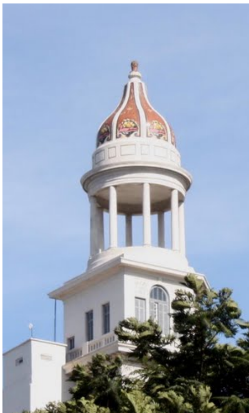
La cúpula que corona el mismo edificio.