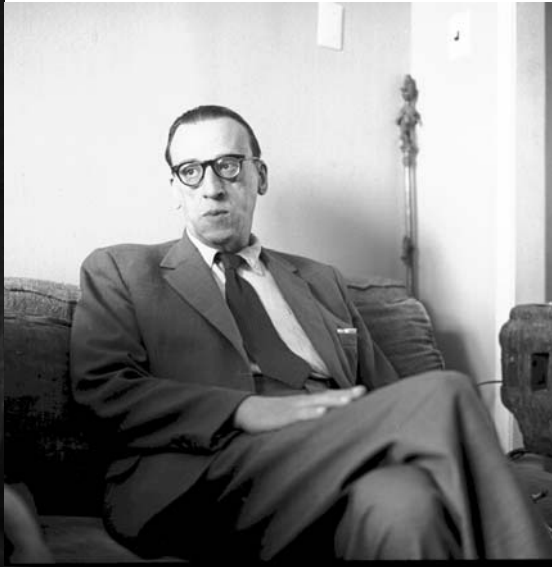
Francisco (Paco) Espínola (1901-1973)