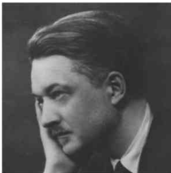
Jacques Maritain (1882-1973)